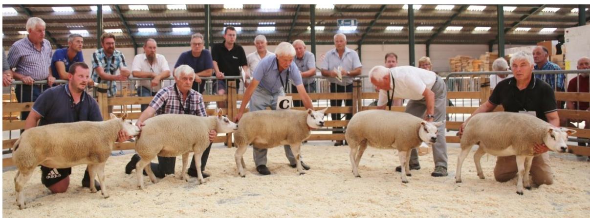
De familie Dossche in pole-position.

Met een bijna unanieme score van 56 punten werd ooi 4062-1746 bekroond tot kampioene. Haar stalgenote 4062-1731 kreeg 32 punten en werd hiervoor beloond met de zilveren beker van de reservekampioene.