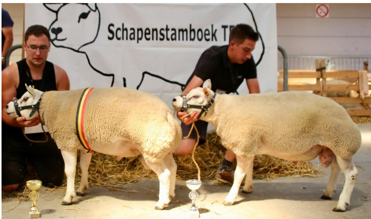
Kampioen en reserve-kampioen in zijaanzicht