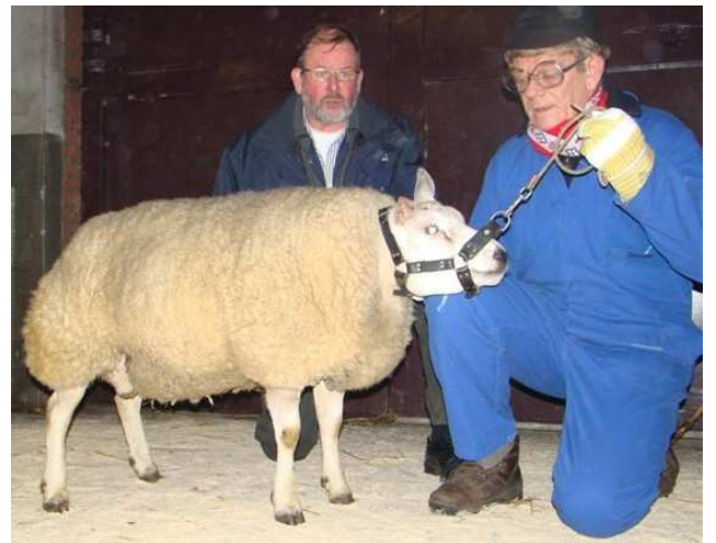
Reserve kampioen ramlammeren