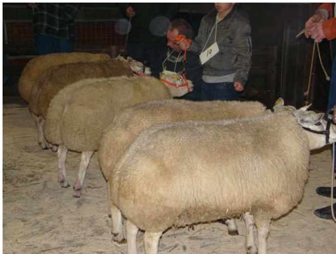
Beste 5 ramlammeren