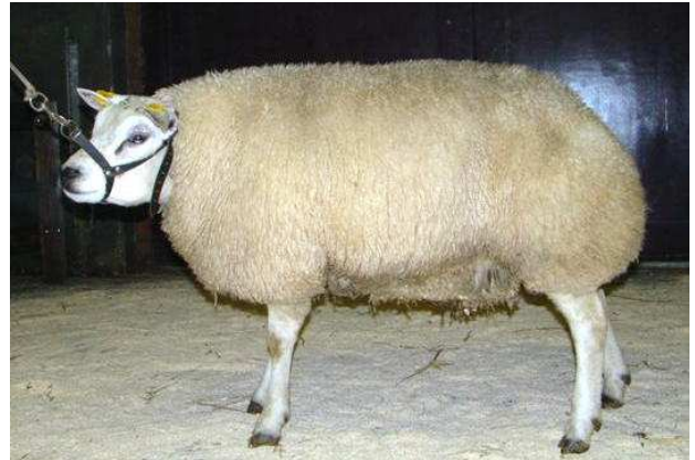
Reserve kampioen ramlammeren