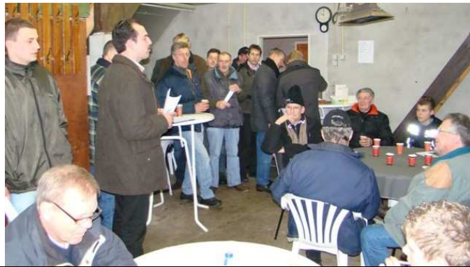
Het gezellige en warme café

Toen we deze morgen vroeg vertrokken was het 2 graden boven nul en was er geen sneeuw meer. Eenmaal voorbij Utrecht lag alles er nog mooi wit bij en in Nieuwleusen waaide er nog een strakke wind. De parking was netjes sneeuwvrij gemaakt, in de cafetaria was het lekker warm en in de schuur hadden de fokkers hun rammen al in de wachtring neergezet in een dikke laag stro. Ik zag dat TES het weer mooi voor mekaar had.