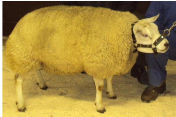
Kampioen 1 jarige rammen