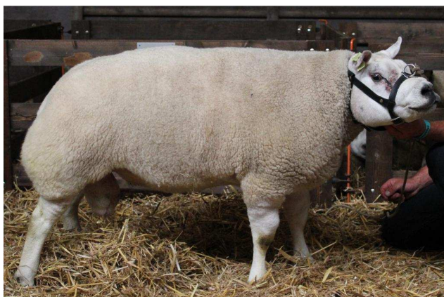
Kampioen oude rammen 04726-01929