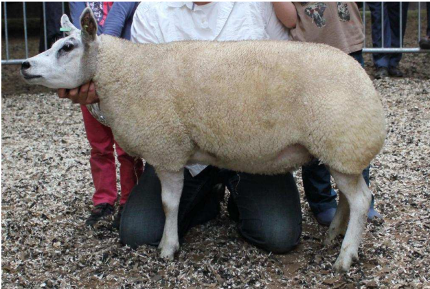
Kampioen 1-jarige ooien gezoogd 04233-00350