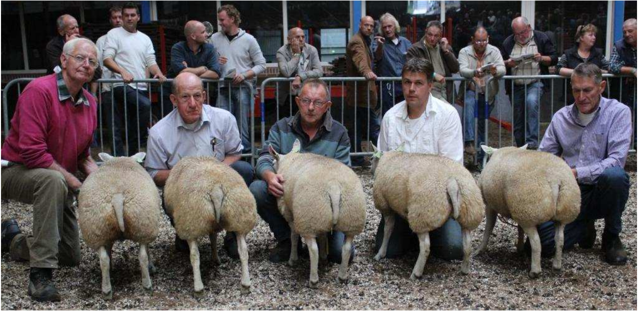
Beste 5 oilammeren