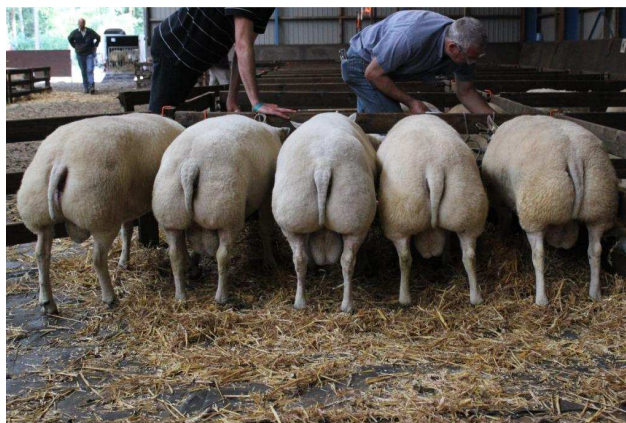
Beste hok bedrijfsgroep 5-tal L. de Reuver