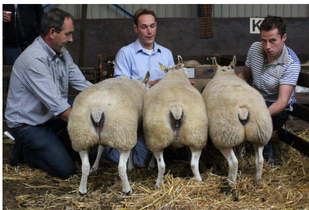
Beste hok 3-tal oude oaien Comb. A. + B. Mol