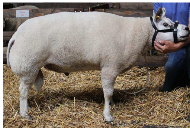
Reserve kampioen oude rammen 04726-01767