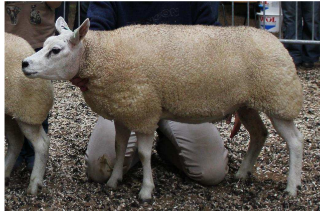
Reserve kampioen 1-jarige ooien gezoogd 04233-00356