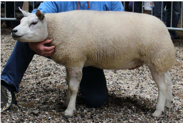
Kampioen 1-jarige ooien niet gezoogd 00919-00885