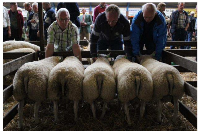
Beste hok afstammingsgroep 5-tal Mts. Vellenga