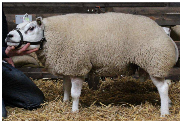
Reserve kampioen 1-jarige rammen 06403-63676