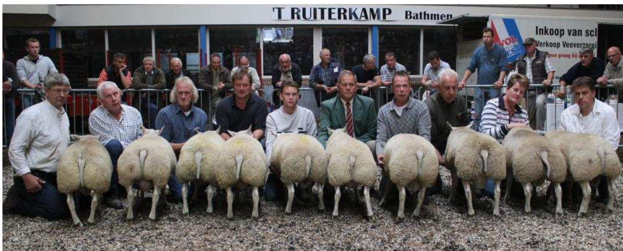
Beste 10 ramlammeren