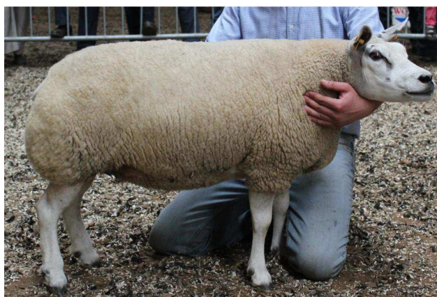
Reserve kampioen oude oaien 01504-01451