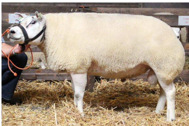
Kampioen 1-jarige rammen 04726-01999