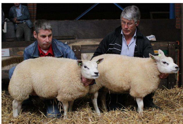
Beste hok 2-tal ooilammeren Comb. H. + P. Piters

In tegenstelling tot de 2 sexegenoten kunnen we de rubriek drietallen omschrijven als goed. Zeer uniform kopnummer met veel ras zien we bij 3 ooien van J. Hellwich. Alle drie ooien, aangewezen, overblijvend bij de laatste 5, zelfs 2 zusjes, te weten 01376-24935 en 24936. Een mooi succes voor de fokker uit den Ham. Heel veel ras demonstreert de groep van A. Westendorp, echter het onderdeel uniformiteit laat te wensen over en verklaart daarmee de 1B plek. Heel veel ontwikkeling, maar juist het missen van rastype uitstraling, doet de inzending van Mts. Eggerink-Veneman op de 3 e plek eindigen.