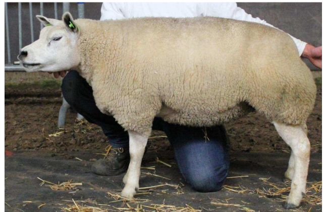
Reserve kampioen 1-jarige ooien niet gezoogd 00228-42320