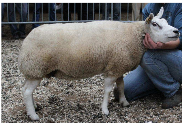
Kampioen oude oaien 01504-01466