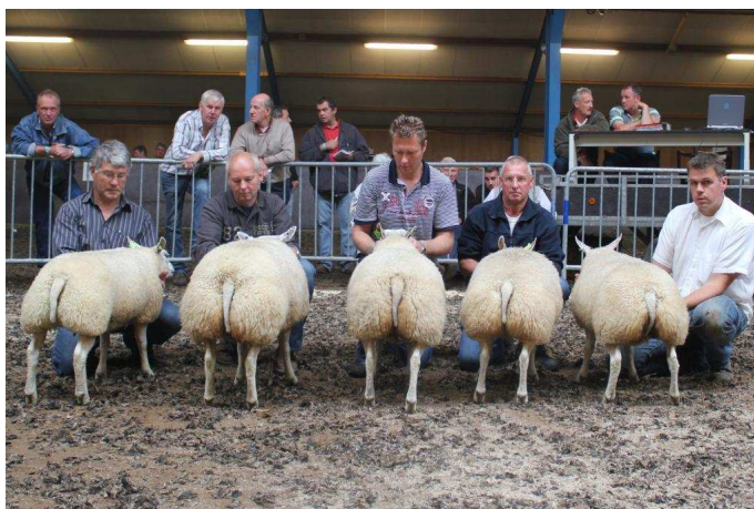
Beste 5 oilammeren