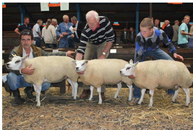
Beste hok Ooi met lammeren