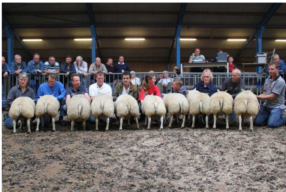
Beste 10 ramlammeren