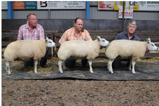
Beste hok afstammingsgroep 3-tal