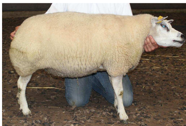
Reserve kampioen 04233-01711