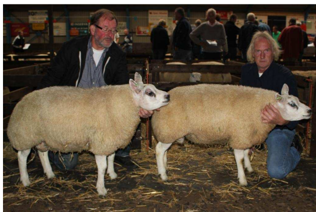
Beste hok 2-tal ramlammeren