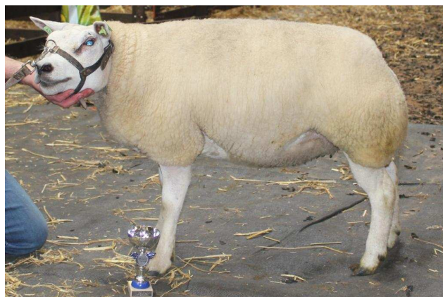
Reserve kampioen 04539-00638