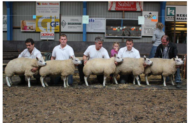
Beste hok afstammingsgroep 5-tal