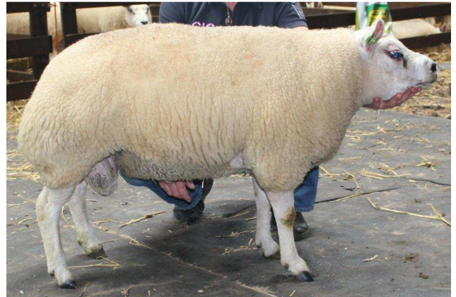
Reserve kampioen 06016-49898