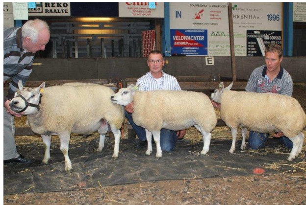
Beste hok bedrijfspgroep 3-tal