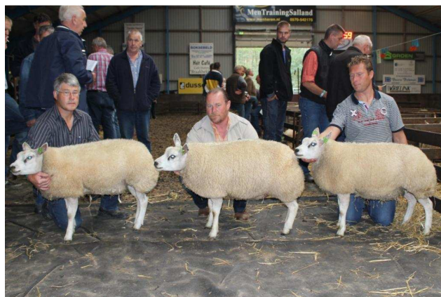
Beste hok 3-tal oilammeren