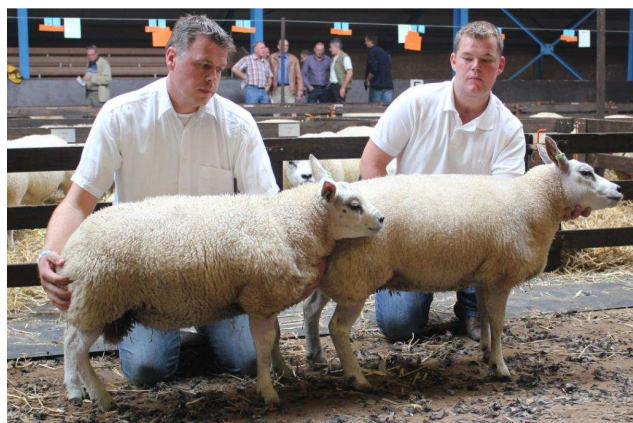
1A 1-jarige ooi met lam(meren)

Ook in deze rubrieken zijn Comb. Olde Veldhuis / Wetsteen en H. Bies van de partij. Daarbij ook R. Hoekstra & zn en kan helaas J. Leefting die ook had opgegeven niet aanwezig zijn. Een uniform stel zien we van H. Bies. Dieren met goede koppen erop en dan hebben we het over de moeder 00668-0786 en oilam 00668-76242 en ramlam 00668-76241. Dit keurige stel wordt tevens tot de beste inzending schaaap met lammeren uitgeroepen. 1B gaat naar R.Hoekstra en zn. Moeder 00293-00624 met 2 ramlammeren 06016-49899 en 06016-49900 zijn best ontwikkeld. Een beste moeder maar de lammeren vertonen niet de adel van de moeder. Comb. Olde Veldhuis / Wetsteen bezet 1C met moeder 04233-01617 en oilam 04233-00359 en ramlam 04233-00360. Een luxe groep en best ramlam maar waar op de evenredigheid van de ooi een bemerking te maken is.