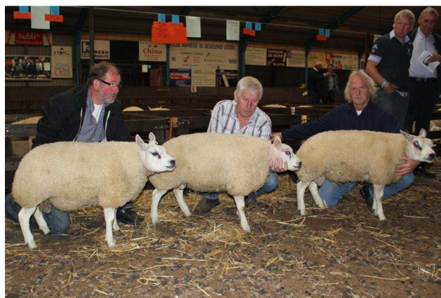
Beste hok 3-tal ramlammeren