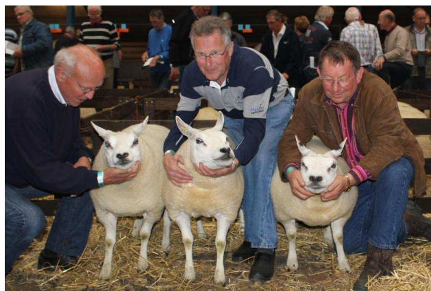
Beste hok 3-tal 1-jarige ooien niet gezoogd