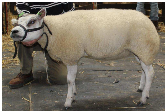
Reserve kampioen 00668-76234