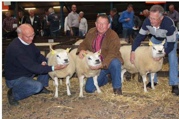
Beste hok 3-tal oude ooiën